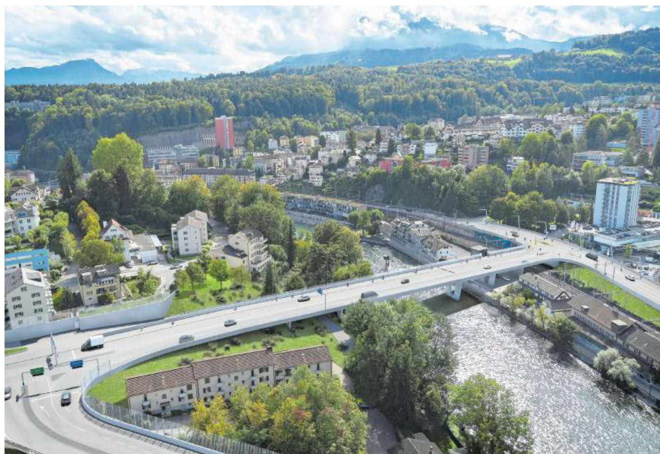
So könnte die neue Brücke über die Reuss dereinst aussehen.